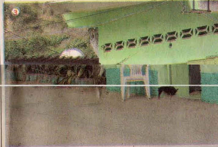
1. Serenita la travesía en kayak 2. La capillita con su enredo de cables 3. Uno de los tarantines donde venden empanadas

A la hora de comer pueden hacerlo en el restaurant que da al estacionamiento, en los tarantines del boulevard o en los kioscos que montaron en la playa. Creo que esta última opción es la más rica, porque te sientas frente al mar con los pies en la arena. Nunca faltan el pescado fresco, los tostones, la ensalada y el hervido. Hay mucha gente que hace empanadas. El menú es siempre el mismo. Lo espantoso es